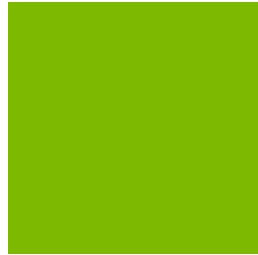
Pantone 376 C