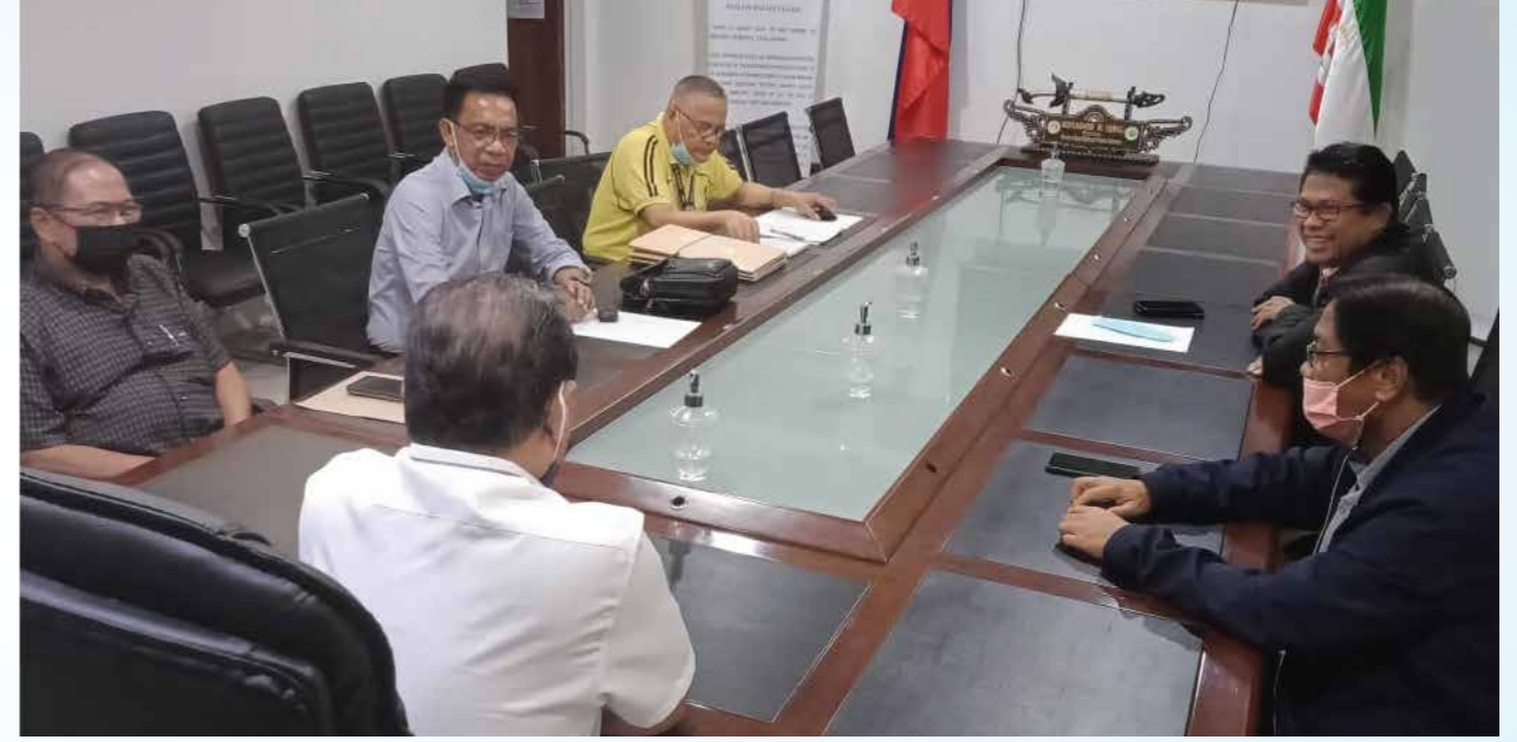
Bangsamoro BTEA Yönetim Kurulu

BTEA INC. SİZE, EN İYİ EĞİTİMİ SUNMANIN PEŞİNDE