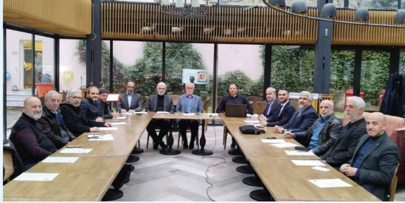
Türkiye BTEA Yönetim Kurulu